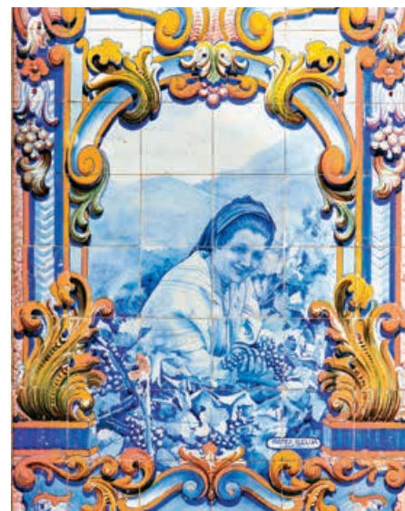
Azulejos, de Portugese siertegels

centrum prijkt sinds 1996 op de lijst van Unesco-werelderfgoed. De op een na grootste stad van Portugal is een lust voor het oog: met een doolhof van straatjes, kleurrijke vissershuisjes,