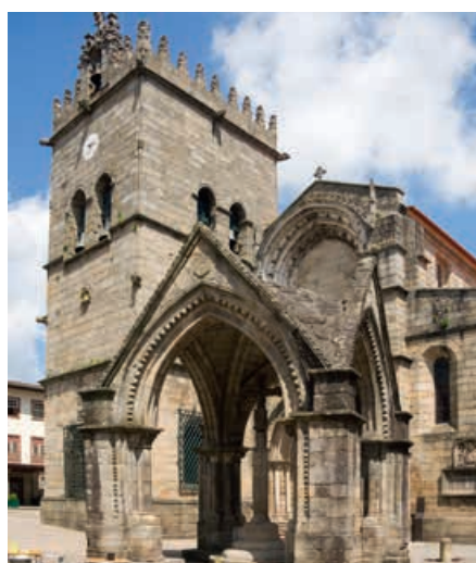
Largo da Oliveira, Guimarães

die naar de top leidt, telt 17 terrassen, elk versierd met symbolische fontein-