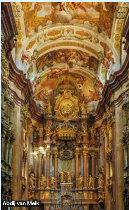
Abdij van Melk

De wereldberoemde abdij van Melk is een van de mooiste voorbeelden van de barokke architectuur uit de periode van de contrareformatie. De abdij maakt deel uit van het Unesco-werelderfgoed. Na een uitgebreid bezoek aan de abdij en de tuinen volgt een niet te missen wijndegustatie. Prijs per persoon: € 70 (halve dag)