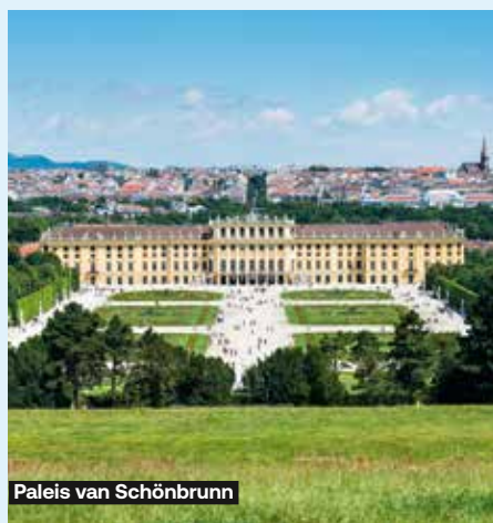
Paleis van Schönbrunn